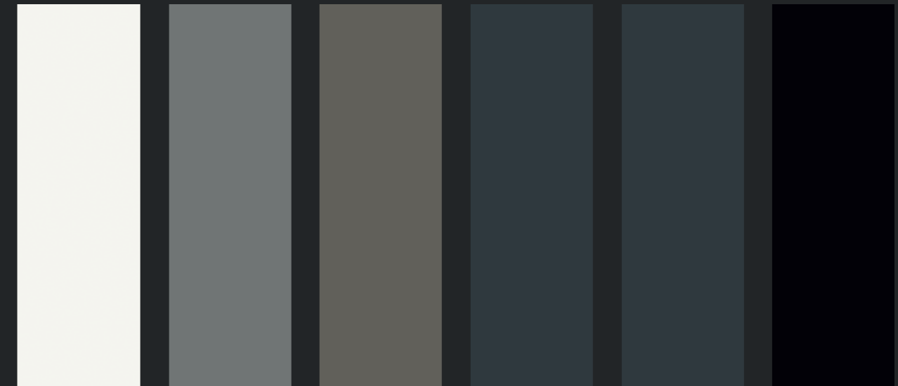
RAL 9010 zuiver wit RAL 7037 stofgrijs RAL 7039 kwartsgrijs RAL 7016 antracietgrijs RAL 7021 zwartgrijs RAL 9005 gitzwart

We streven naar een zo nauwkeurig mogelijke benadering van de RAL-kleur. Vraag een staal aan om de kleurmacht te controleren.