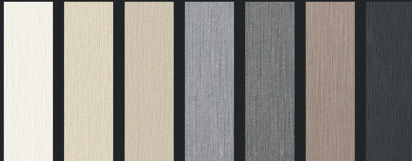
TE90 wit TE00 roomwit TE10 lichtbeige TE15 lichtgrijs TE20 grijs TE60 lichtbruin TE85 grafiet