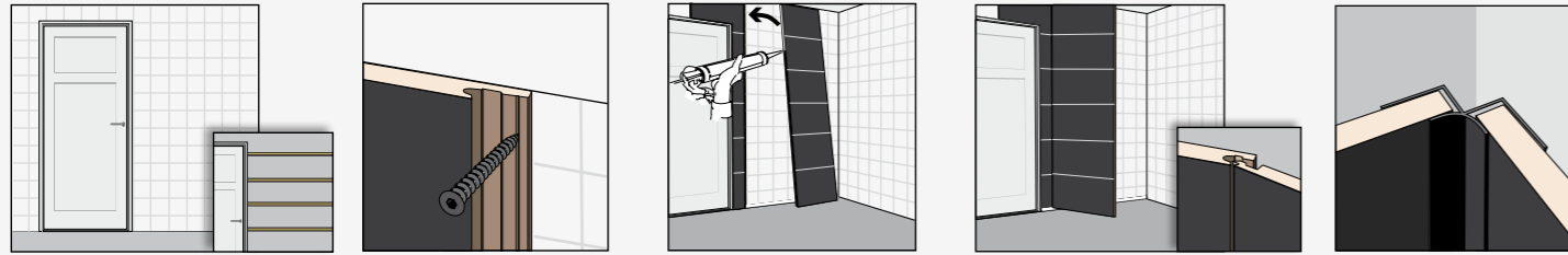
Ondergrond tegels of regelwerk