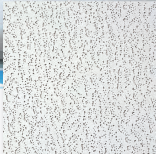
Oppervlakedessin Harmony Harmony 72